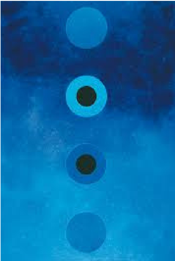
CÍRCULOS NO ESPAÇO DE IVAN SERPA