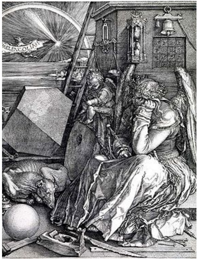
MELANCOLIA I GRAVURA DE ALBRECHT DÜRER

O MEU ITINERÁRIO SEGUIE A TODO "VAPOR", PRETENDO CONTINUAR NESTES PASSOS: PARTINDO DA IMERSÃO ARTÍSTICA, CONTINUANDO NA IMERSÃO MATEMÁTICA REALIZANDO OS PROCESSO DE CARTOCURAR/CARTOFAZER NA ÂNSIA DE EDUCAR MEU OLHAR PARA O ALCANCE DO OLHAR INTERDISCIPLINAR. PERCEBO QUE A TRILHA INICIAL FOI FEITA, NO ENTANTO, JÁ SINTO QUE PELAS EXPERIÊNCIAS VIVIDAS COM MONDRIAN QUE É POSSÍVEL QUE ALGUNS ASPECTOS AINDA POSSAM MUDAR PARA A CONSTRUÇÃO DESSA TRILHA COM A INTENÇÃO DE TER A COMPETÊNCIA DE CARTOCURAR/CARTOFAZER, RELACIONANDO CADA VEZ MAIS ESSE ATRAVESSAMENTO E O ENTRELAÇAMENTO ENTRE MATEMÁTICA E ARTE FOMENTANDO, DESSA FORMA, A SENSIBILIZAÇÃO DO OLHAR E DA PERCEPÇÃO QUE BUSCO DESDE QUE DEI O PRIMEIRO PASSO NESSE CAMINHAR CARTEMÁTICO.